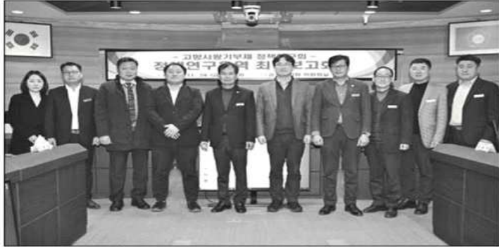
순창군의회는 지난 24일 '고향사랑기부제 정책연구회 정책 연구용역 최종 보고회'를 의회 위원회실에서 개최했다.

보고회에서 "농촌의 빈집을 정비하여 기부자가 순창을 찾아 자유롭게 쉬어갈 수 있도록 하자", "기부자의 이름을 지역신문에 게재해 주었으면 좋겠다", "사용하지 않은 포인트를 기부