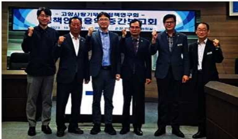
순창군의회 고향사랑기부제 정책연구회는 지난 19일 순창군의회 위원회실에서 ‘고향사랑기부제 정책연구회 정책연구용역중간보고회’를 개최했다.

난 19일 순창군의회 위원회실에서 ‘고향사랑기부제 정책연구회 정책 연구용역 중간보고회’를 개최했다.