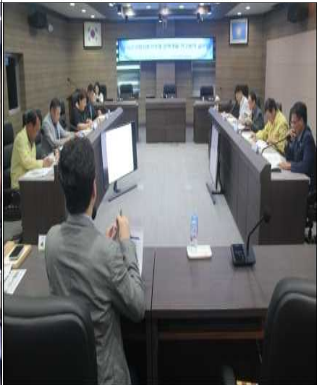
▲ 순창군 고향사랑기부제 정책개발 연구용역 설명회