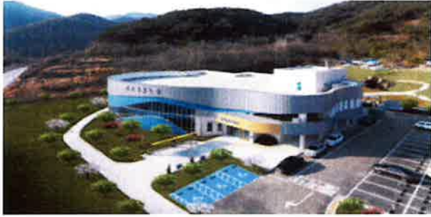
힐링 스파 전경